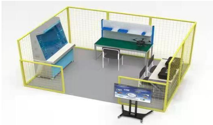
图 1 人工智能无人机装调检修工竞赛平台工位布局图