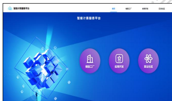
智能计算服务平台