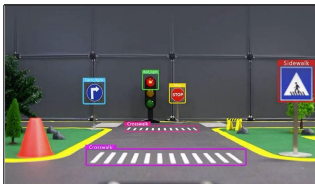
自动驾驶场景沙盘